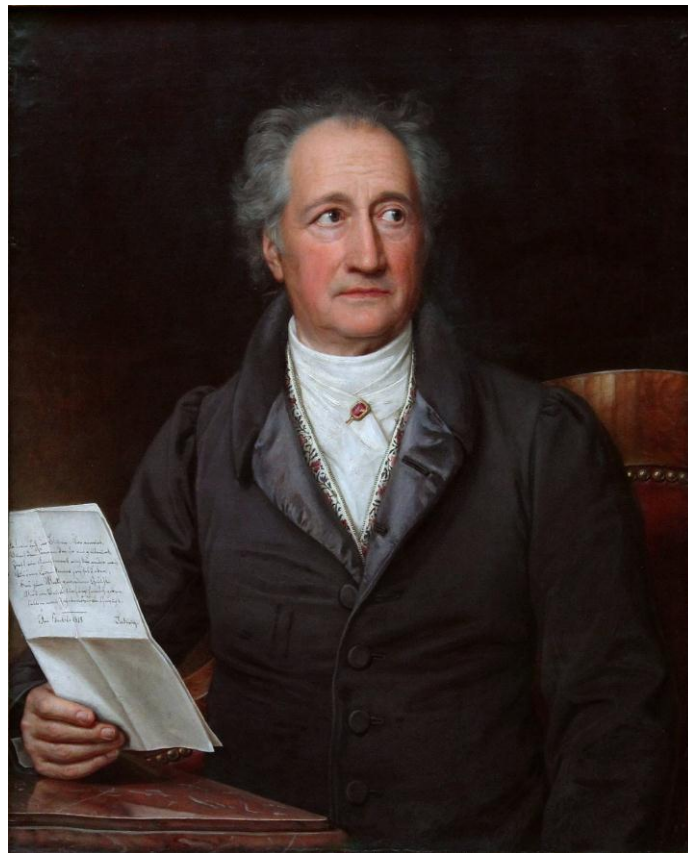
J.K. Stieler – J.W. v. Goethe